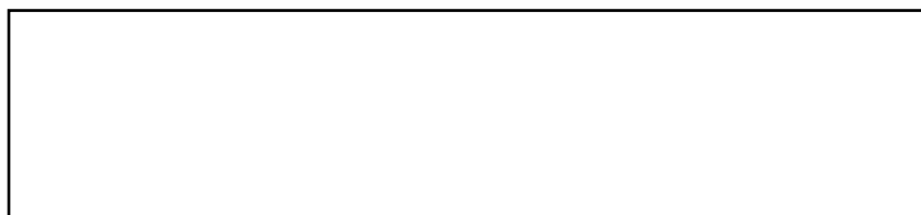
Рисунок 1 – Показатели заболеваемости ....(M±m, % и т.п.)

Требования к структуре научно-исследовательской работы определяются её вариантом.